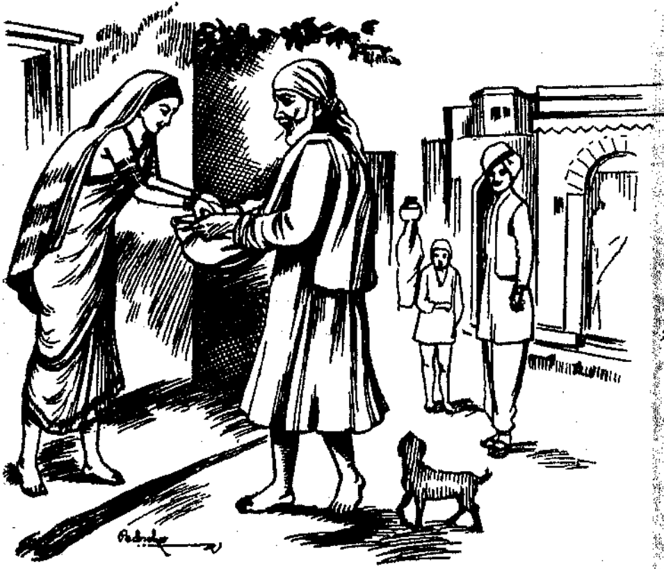
साईबाबा भिक्षा मागताना